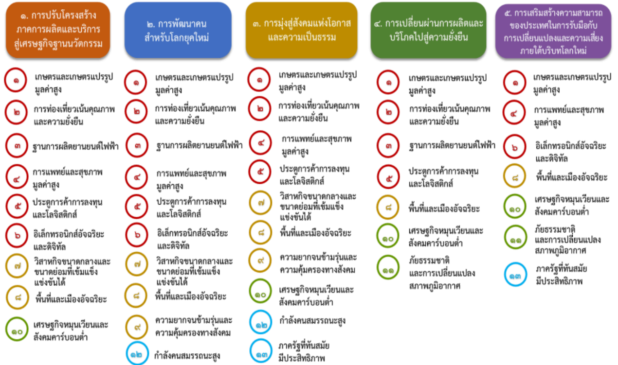
แผนภาพที่ ๓.๑ ความเชื่อมโยงระหว่างหมวดหมู่การพัฒนา กับเป้าหมายหลัก

ทำให้หมายความว่าแต่ละประการสามารถสนับสนุนเป้าหมายหลักได้มากกว่าหนึ่งข้อ นอกจากนี้การพัฒนาภายใต้แต่ละหมายความว่าไม่ได้แยกขาดจากกัน แต่มีการสนับสนุนหรือเอื้อประโยชน์ซึ่งกันและกัน